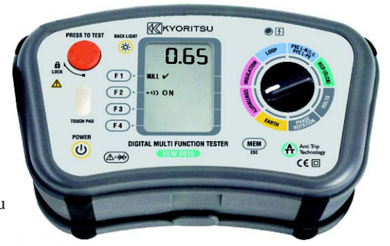
KEW 6016 -asennustesteri.

Elektro-Tukku Oy PL 154 (Kirkonkyläntie 37 B) 00701 HELSINKI Puh. (09) 350 5500 myynti@elektrotukku.fi www.elektrotukku.fi